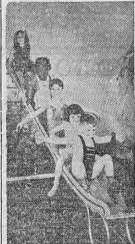
A divertirse tocan 5 estrellas de las comedias por "La Penitencia" de Hal Roach, producciones de la Metro-Goldwyn-Mayer.